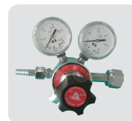
专用 CO 2 减压阀